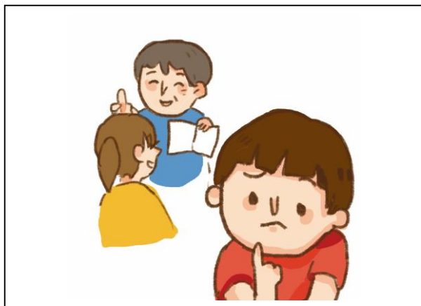
情境 3：字寫得很漂亮