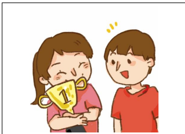
情境 5：比賽獲得前三名