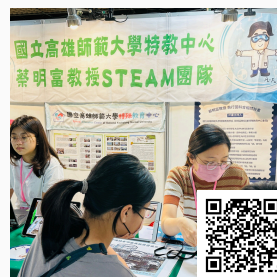
國立科學工藝博物館 推廣科學教育