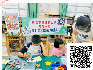
屏東縣高樹國小辦理 仁寶挺科學活動