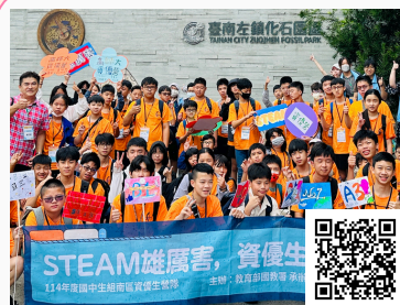
國教署國中 資優學生STEAM營隊