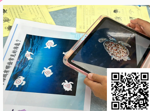
台南市山上區山上國小 寄居蟹AR營