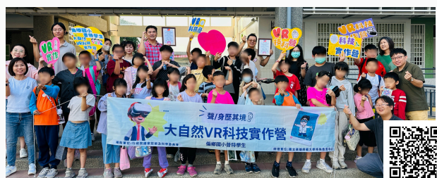
屏東縣高樹鄉田子國小辦理VR科技營