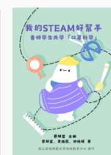
普特學生 口罩科學