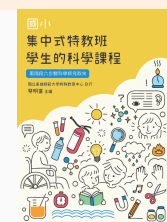
國小集中式特教班 學生的科學課程