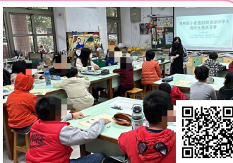
嘉義縣番路鄉民和國小 海洋生態保育營