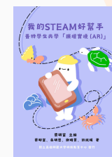
普特學生 擴增實境(AR)