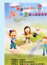
腦力激盪融入 創意教學