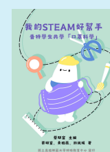
普特學生共學 「口罩科學」