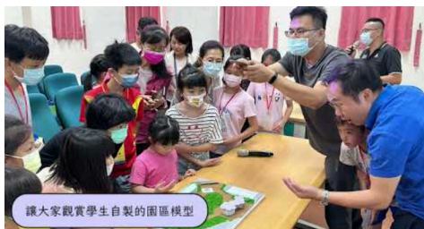
資優學生特殊需求領域課程