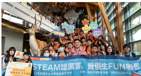
國中資優學生營隊 (國教署)