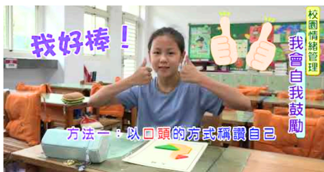
雙重特殊需求學生社會技巧教學