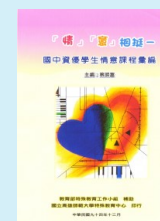
國中資優生情意 課程彙編