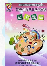
區分性教學 成果彙編