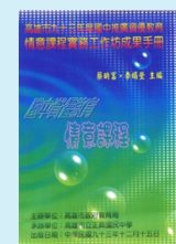
國中推廣情意 課程手冊