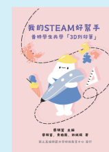
普特學生共學 「3D列印筆」