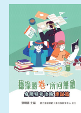
公職特攻隊- 應試篇