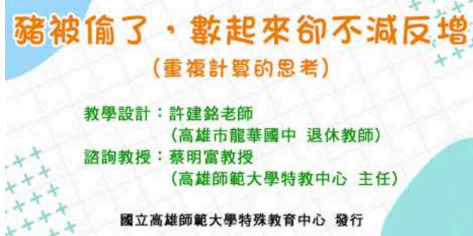
資優學生多元學習課程 (數學)